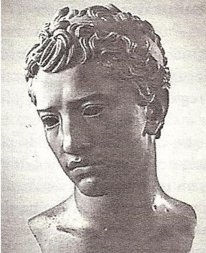
Busto de Juba II